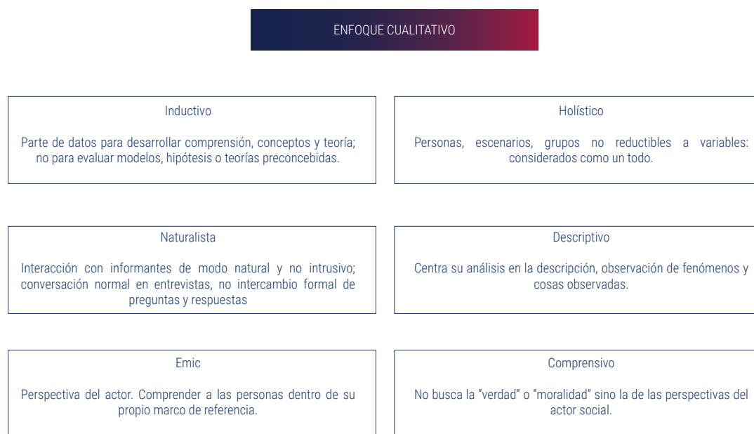
Figura 1 Características del enfoque cualitativo de investigación

Nota. Figura elaborada con base en Metodología de la investigación cuantitativa y cualitativa. Guía didáctica , por Monje, 2011.