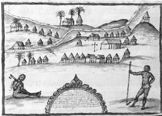
Figura 2. Ilustración de indígenas y viviendas en la Provincia de Citará, Choco, 1687. Adaptado de “Anónimo (1687). Provincia de Citará: Pueblo de Negua, 1687”. En AGI: Signatura: MP-PANAMA, 381.

También practicaron la agricultura empleando el sistema de roza , cortando y quemando la maleza para preparar el terreno y, así, sembrar el maíz; eran cazadores de danta 5 , perdices, conejos, ciervos y otras especies. Los utensilios y armas utilizadas para la caza y la guerra, eran la lanza, los dardos y el arco. Practicaron la artesanía con la elaboración de cestos y botes en madera. Usaban guayuco – pampánilla o taparrabo de hoja de palma. Practicaron la orfebrería y la explotación de oro de aluvión, como sus ancestros, la cultura de Tumaco – La Tolita (600 A.C.-300 D.C). Tuvieron gran cantidad de oro que usaron para joyas en las orejas, narices y pecho, frente y manillas (Arboleda, 1963).